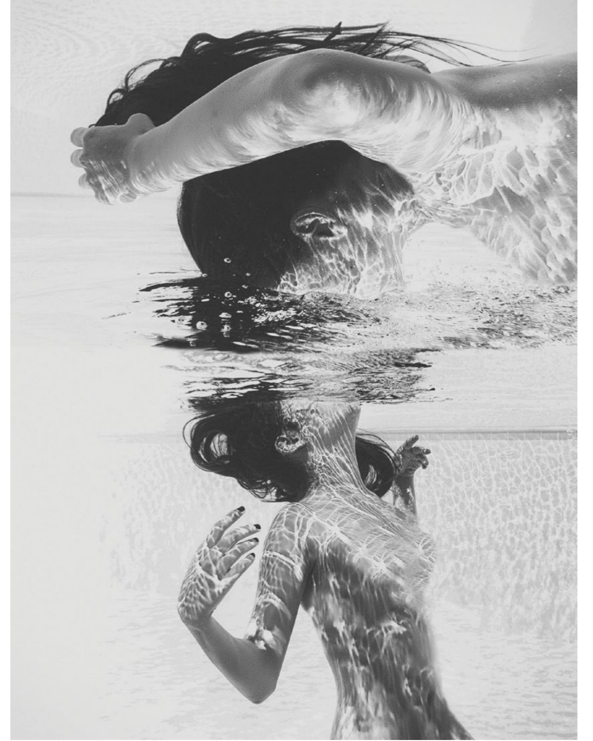
Eda Emirdağ, Oxygen ii, 2014 50x70 cm, Işıklı Kutuda Fotoğraf, Ed. 3+1 AP Eda Emirdağ, Oxygen ii, 2014 50x70 cm, Photograph in a Lightbox, Ed. 3+1 AP

Eda Emirdağ was born in 1986 in İstanbul. After studying International Relations at Sofia University, she decided to take formal education in photography which was already her profession. In 2013 she enrolled in Bahçeşehir University Department of Photography and Video and in the same year her works were exhibited at Mamut Art Project. Having participated to several national and international exhibitions in 2013-2015 at institutions such as BauExp Galeri, Make City Project-Berlin and Kultivera-Tranås, in her works Emirdağ presents the space, the objects and characters as a whole. In her photographs where she mostly prefers to leave the characters' faces anonymous, she invites the viewer to build a subjective connection with open-ended stories.