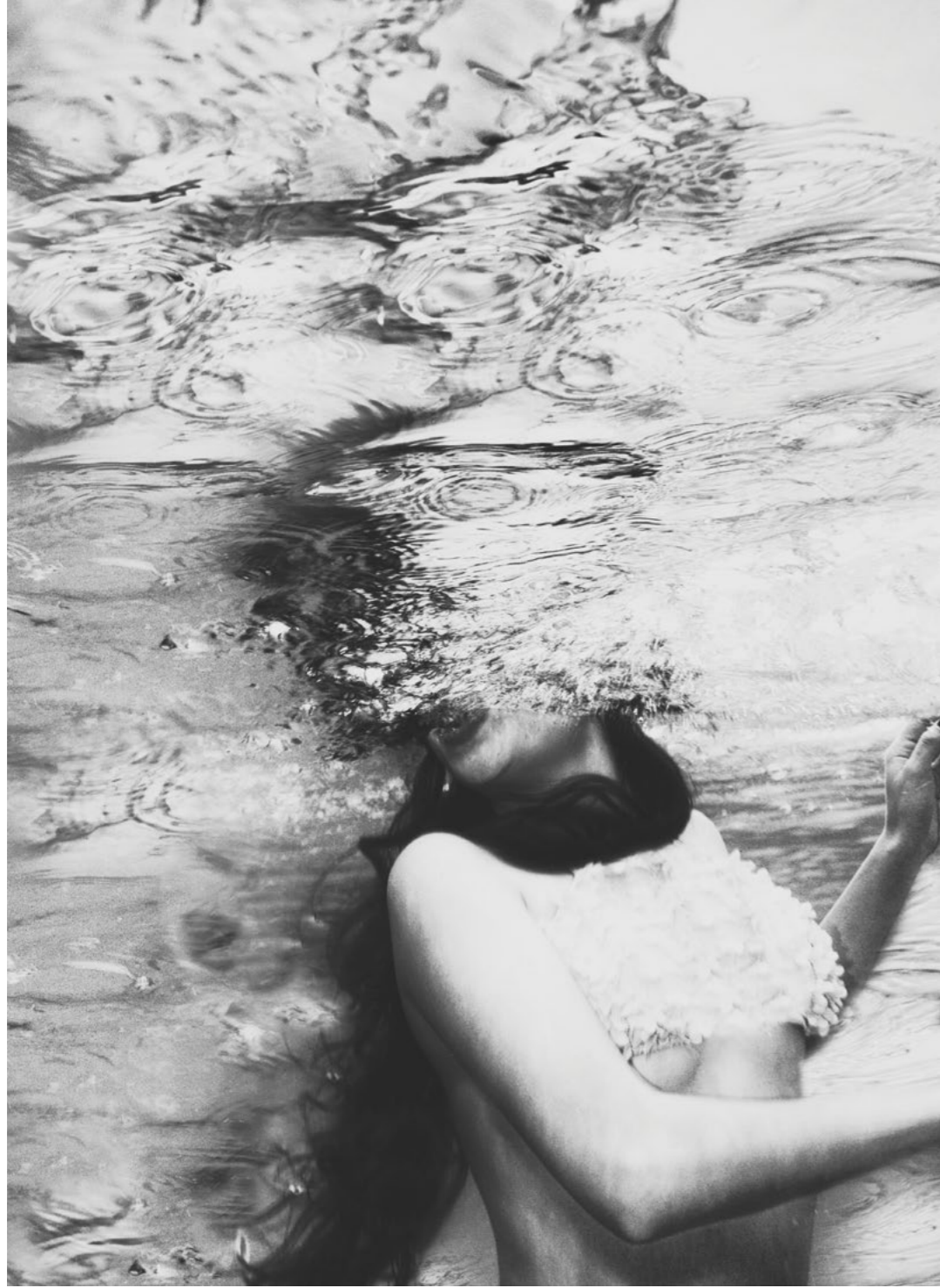
Eda Emirdağ, Quiet Deep , 2014 50x70 cm, Işıklı Kutuda Fotoğraf , Ed. 3+1 AP Eda Emirdağ, Quiet Deep , 2014 50x70 cm, Photograph in a Lightbox , Ed. 3+1 AP