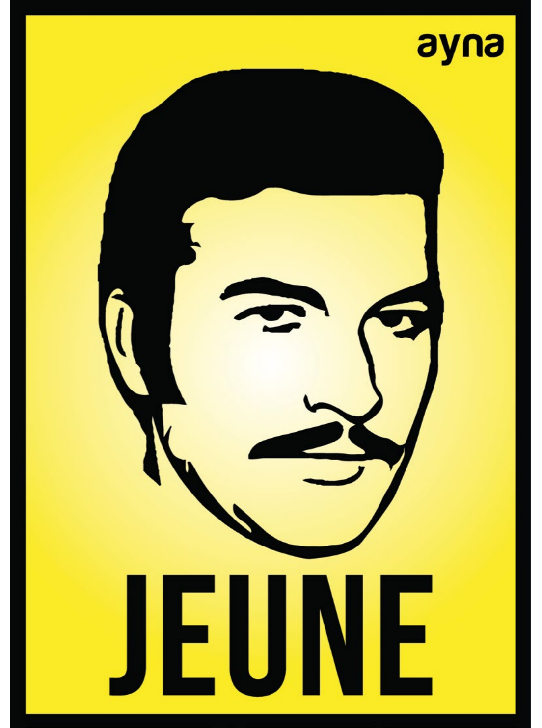
Ayna, Jeune-Kartal Tibet, 2016 50x70 cm, Işıklı Kutu İçinde Baskı, Ed. 3+1 AP

"As every street artist has a nickname, I have chosen 'ayna' for myself. My purpose was to make people see the reflections of my works in their lives as well when they looked at them. At the end of the day, art is the reflection of the society."