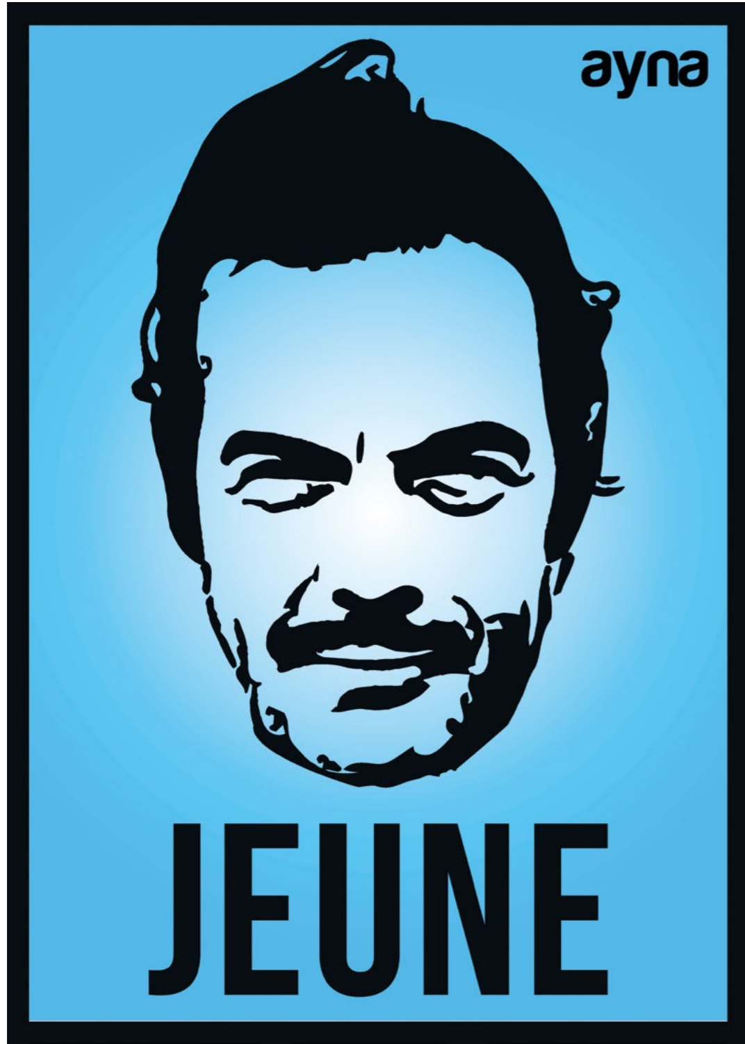
Ayna, Jeune-Ayhan Işık, 2016 50x70 cm, Işıklı Kutu İçinde Baskı, Ed. 3+1 AP