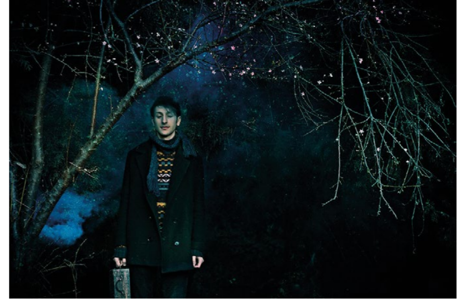
Eda Emirdağ, Forest Fascinated Me , 2013 70x46 cm, Fine Art Baskı Fotoğraf , Ed. 3+1 AP Eda Emirdağ, Forest Fascinated Me , 2013 70x46 cm, Fine Art Print Photograph , Ed. 3+1 AP