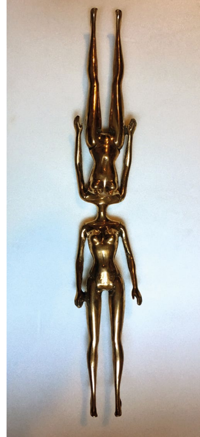
Genco Gülan, İkiz Barbie, 2015 48x10x3 cm, Bronz

Born in 1969 in İstanbul, Genco Gülan is an artist and theoretician who defines all contemporary artworks including painting, sculpture, performance and new media as 'idea art'. He received his first award in 1993 from BP, followed by 2000 New School, 2005 EMAF, 2011 Sovereign European Art and 2015 Ege Art awards. His works were exhibited at important institutions including Centre Pompidou, ZKM, Pera Museum, MAM Rio de Janeiro and La Triennale Milano; they entered the collections of Rhizome.org at the New Museum, İstanbul Modern, Museum Oswald, Davis Museum, Elgiz, Baksı and Thessaloniki Contemporary Art Museum. Gülan participated to Steirishes Herbst, Ars Electronica, Mediaterra, prog-me, Accente, Balkan Art, Moving Tehran and Bonn Biennials. His performances were featured in leading festivals like İstanbul Theatre Festival, Xchange PAP Tel Aviv, Wunderbar New Castle, Fringe New York, Moving Silence Athens and Accente Duisbug. He held lectures at universities like Yale, SVA, Bilgi, New York Institute of Technology, Incheon and Cologne. As the founder of the Web Biennial, Genco Gülan served as the consulting committee member of the Balkan Biennial and the ISEA International program committee member.