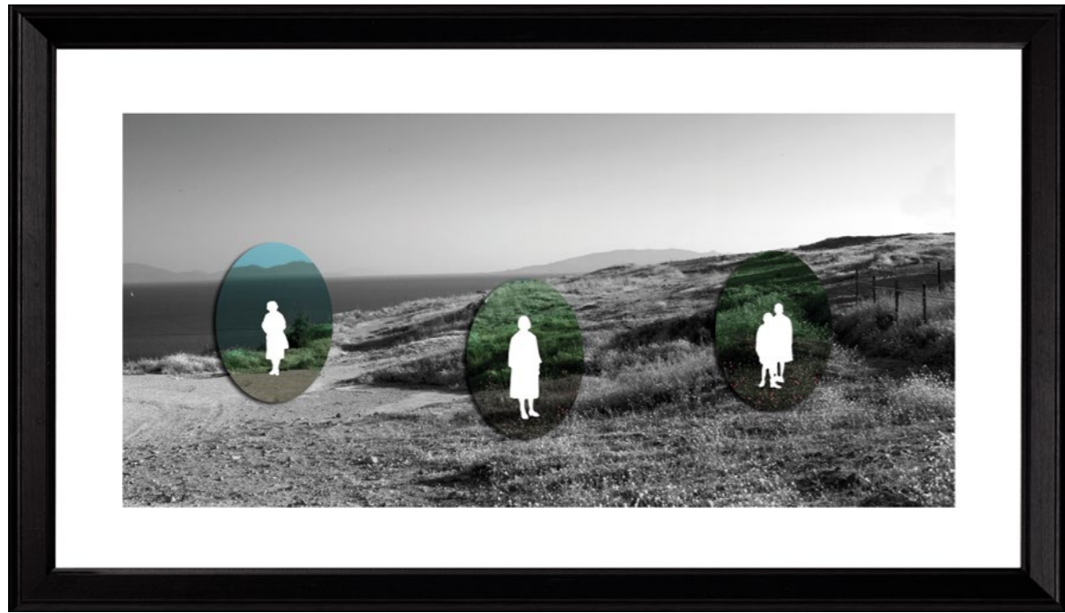
Deniz Yılmazlar | Karbon, İsimli No:2, 2015 70x35 cm, Fine Art Kağıdına Siyah Beyaz Fotoğraf ve Elips Seramik

Deniz Yılmazlar | Karbon, Untitled Nr:2, 2015 70x35 cm, Black And White Photography On Fine Art Paper And Ellipse Ceramic