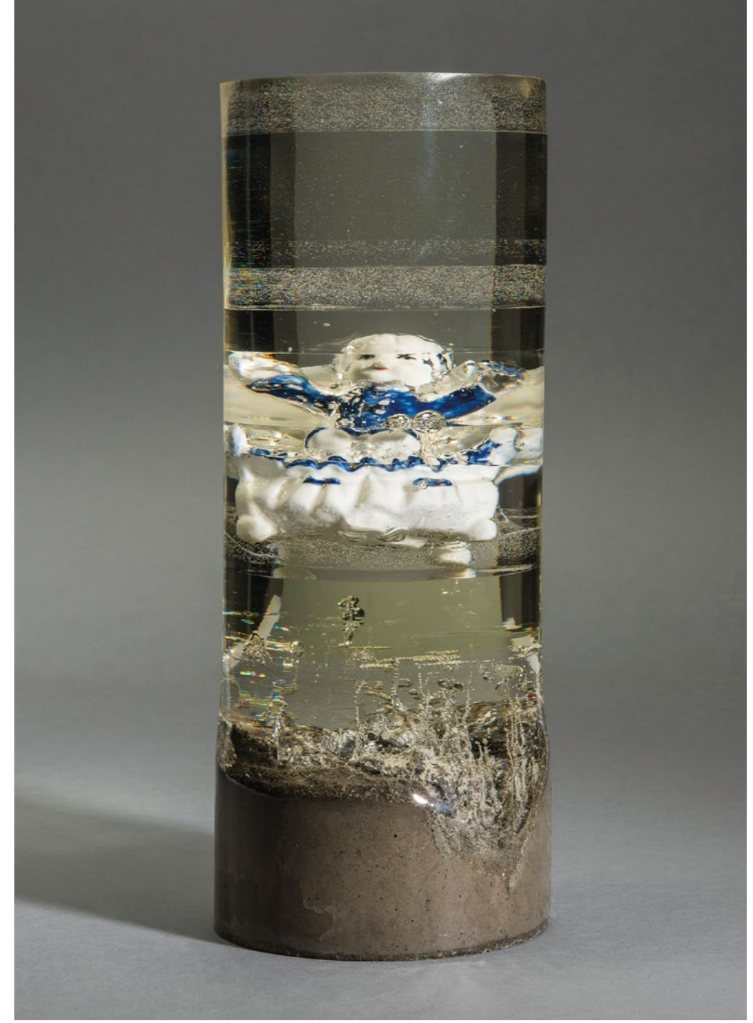
Aslı Aydemir, Oturan Çocuk, 2016 11x30 cm, Porselen Mavi-Beyaz Biblo, Epoksi ve Beton