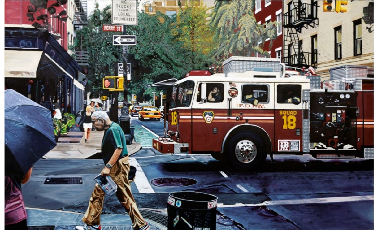
Yıldırım İnce, Metropol ve İtfaiye, 2013 130x81 cm, Tuval Üzerine Yağlıboya

Having studied “Photorealism and the Metropolis in Contemporary Art” in his Master’s thesis, in his works İnce focuses on things the city life brings. Instead of daily life’s ordinary elements, he is interested in the mythological imagery from the city’s popular culture, such as motorcycles, restaurants, bars, cars and neon signs.