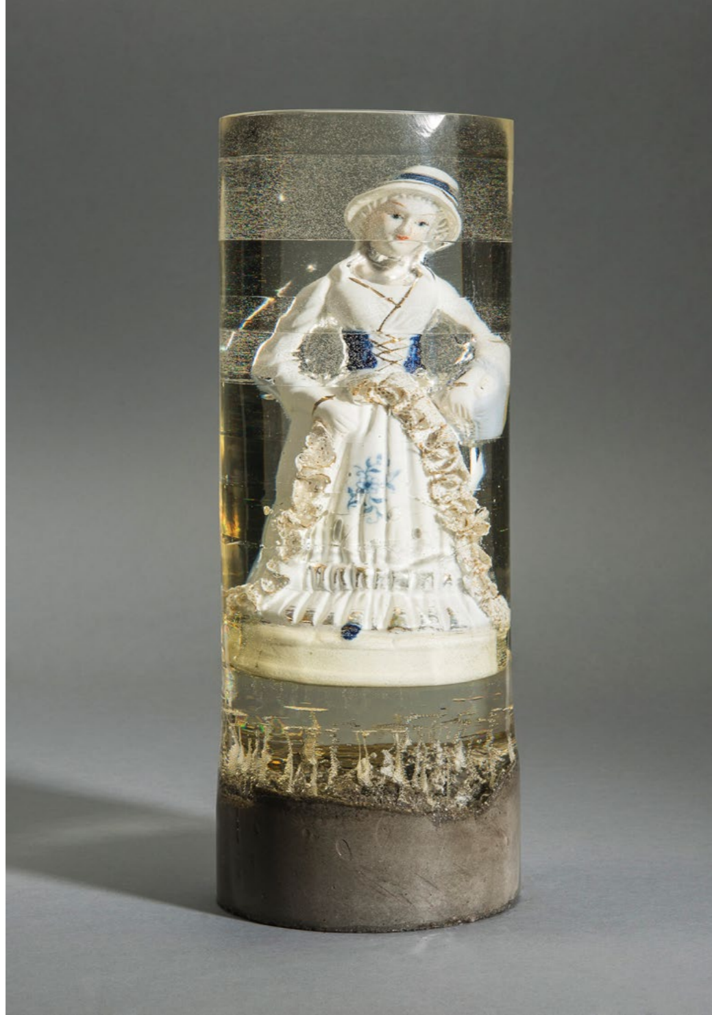
Aslı Aydemir, Kontes Fırfirella, 2016 11x33 cm, Porselen Mavi-Beyaz Biblo, Epoksi ve Beton