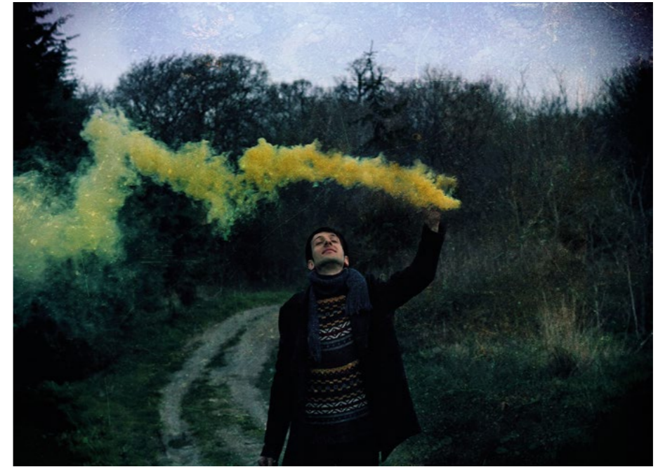
Eda Emirdağ, Forest Fascinated Me ii , 2013 70x50 cm, Fine Art Baskı Fotoğraf , Ed. 3+1 AP Eda Emirdağ, Forest Fascinated Me ii , 2013 70x50 cm, Fine Art Print Photograph , Ed. 3+1 AP