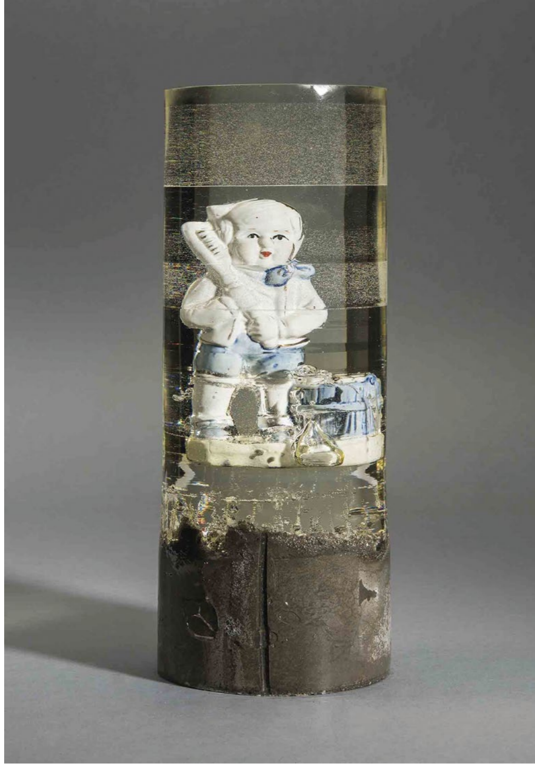
Aslı Aydemir, Taraklı Ođlan, 2016 11x30 cm, Porselen Mavi-Beyaz Biblo, Epoksi ve Beton Aslı Aydemir, The Boy With The Comb, 2016 11x30 cm, Porcelain Blue-And-White Figure, Epoxy And Concrete