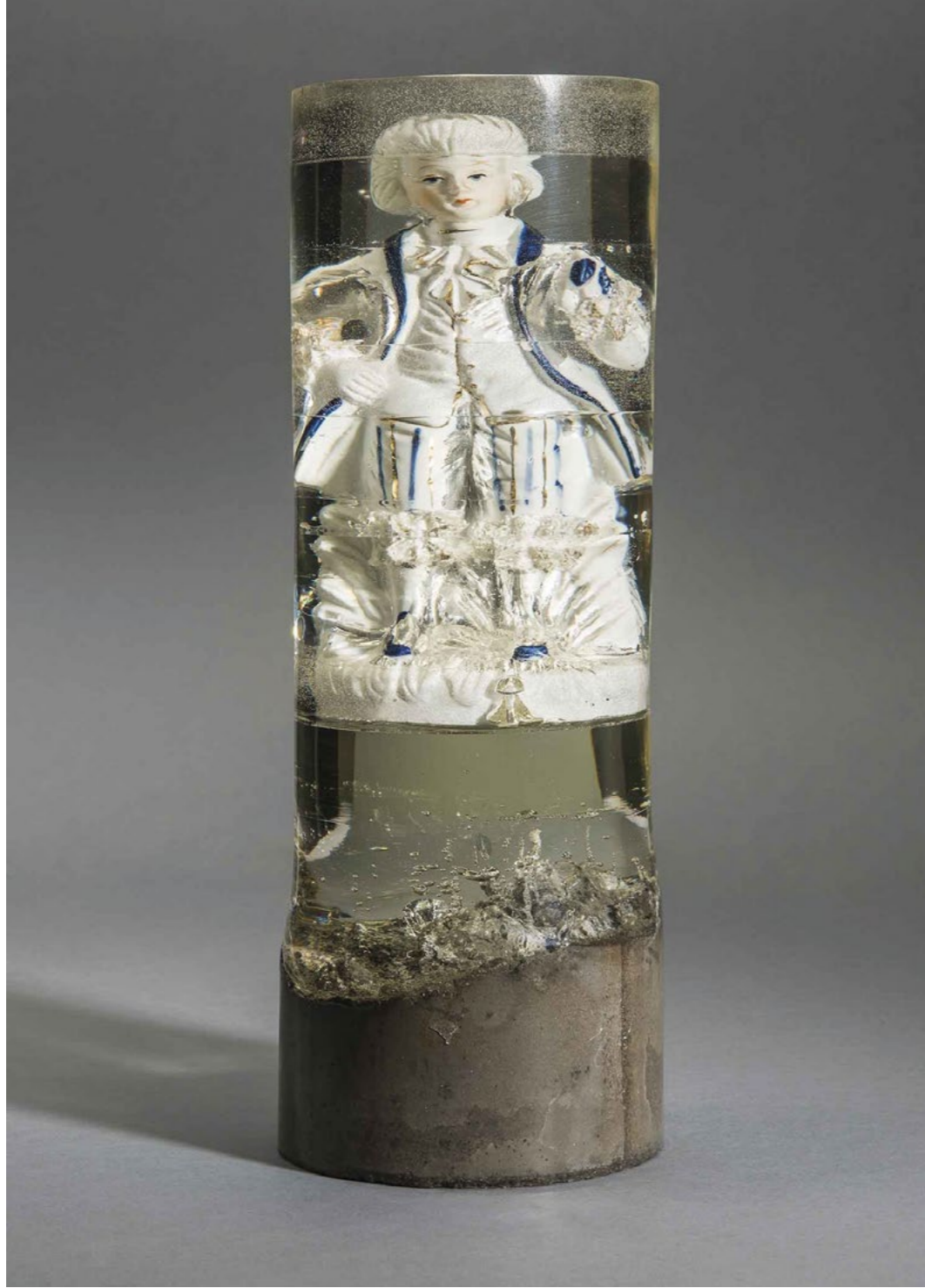
Aslı Aydemir, Mizamplili Genç, 2016 11x33 cm, Porselen Mavi-Beyaz Biblo, Epoksi ve Beton Aslı Aydemir, The Youngster With a Hooded Dryer, 2016 11x33 cm, Porcelain Blue-And-White Figure, Epoxy And Concrete