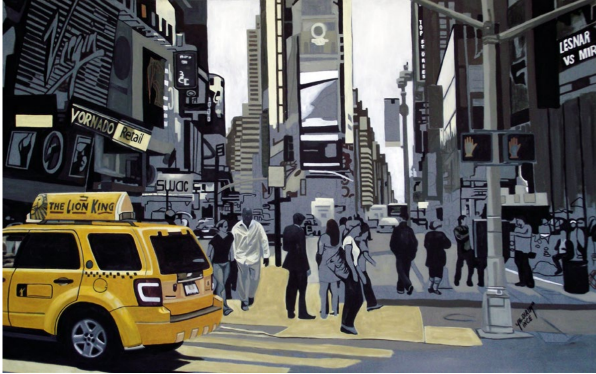
Yıldırım İnce, Metropolitan, 2013 130x81 cm, Tuval Üzerine Yağlıboya