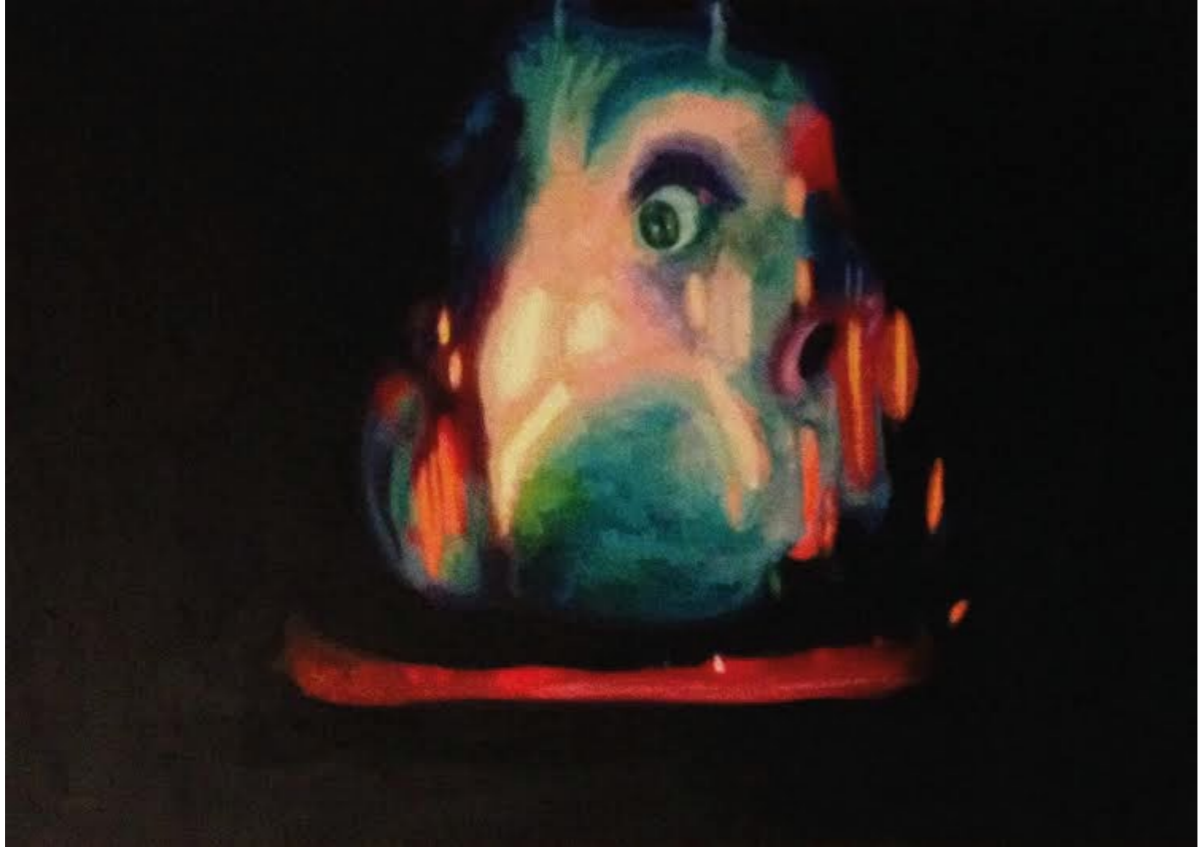
Aslı Dinç, The Man Who Escaped From Space, 2011 50x35 cm, Tuval Üzerine Akrilik Aslı Dinç, The Man Who Escaped From Space, 2011 50x35 cm, Acrylic On Canvas