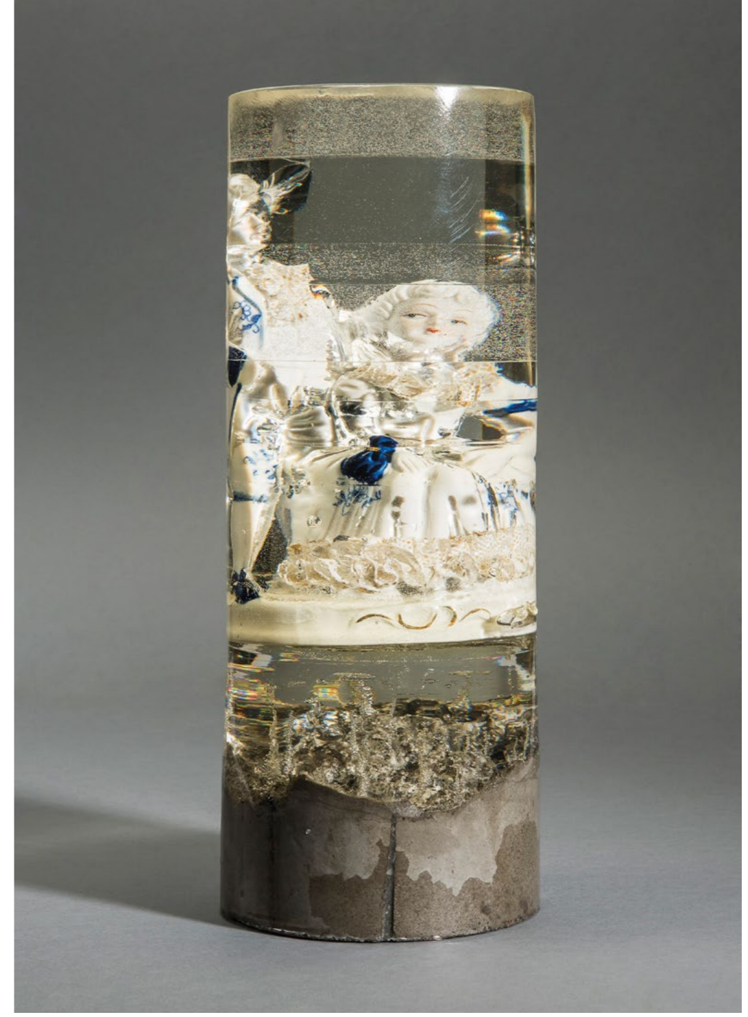
Aslı Aydemir, Dayanak 2, 2016 11x30 cm, Porselen Mavi-Beyaz Biblo, Epoksi ve Beton Aslı Aydemir, Base 2, 2016 11x30 cm, Porcelain Blue-And-White Figure, Epoxy And Concrete