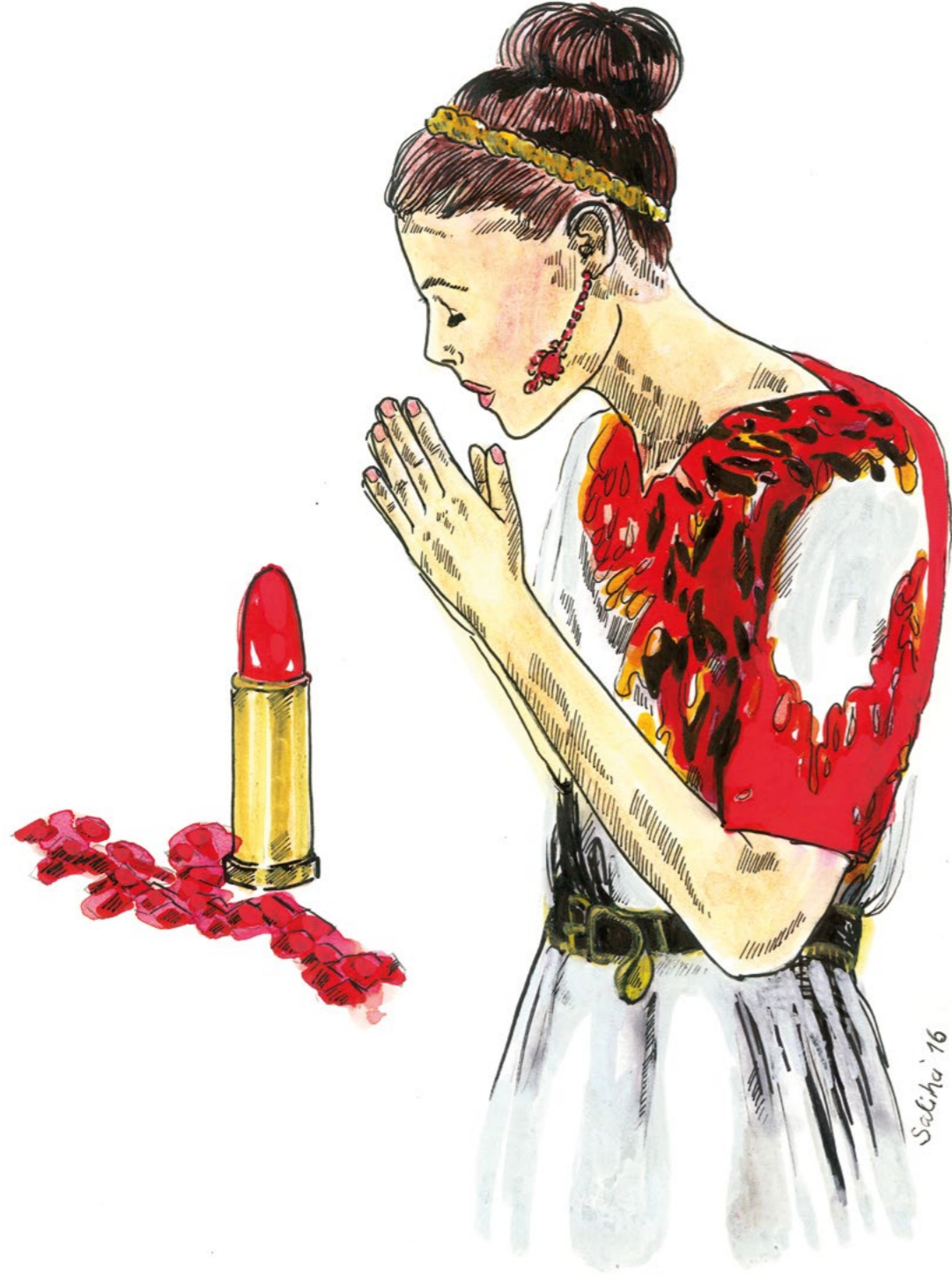
Saliha Yılmaz, Tapınak, 2016 21x30 cm, Kağıt Üzerine Karışık Teknik

Saliha Yılmaz, Shrine, 2016 21x30 cm, Mixed Media On Paper