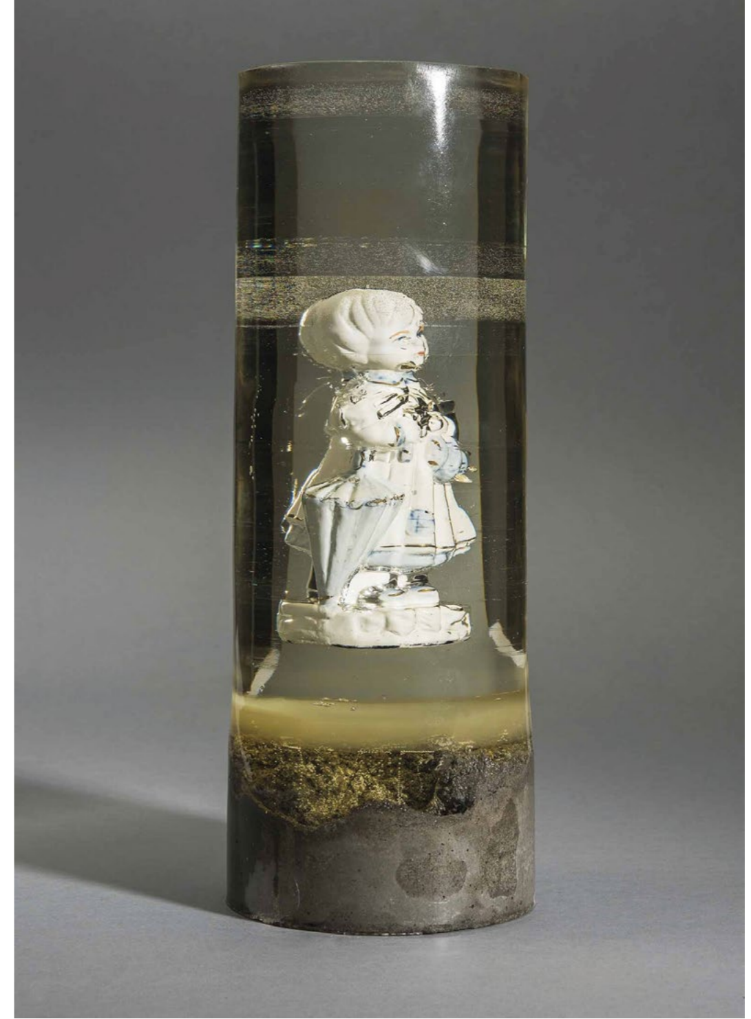
Aslı Aydemir, Şemsiyeli Kız, 2016 11x32 cm, Porselen Mavi-Beyaz Biblo, Epoksi ve Beton Aslı Aydemir, The Girl With The Umbrella, 2016 11x32 cm, Porcelain Blue-And-White Figure, Epoxy And Concrete