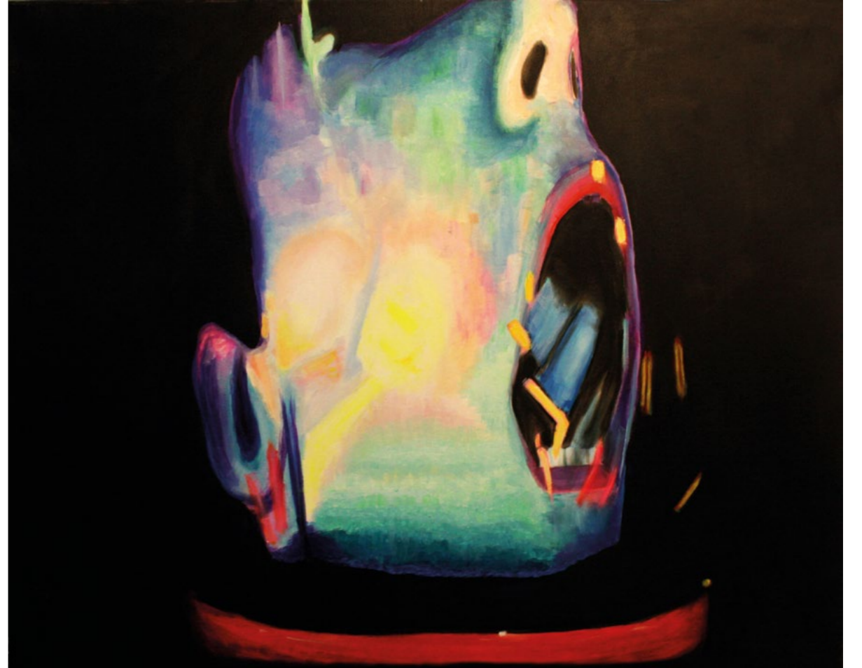
Aslı Dinç, Mutation, 2012 100x80 cm, Tuval Üzerine Akrilik Aslı Dinç, Mutation, 2012 100x80 cm, Acrylic On Canvas