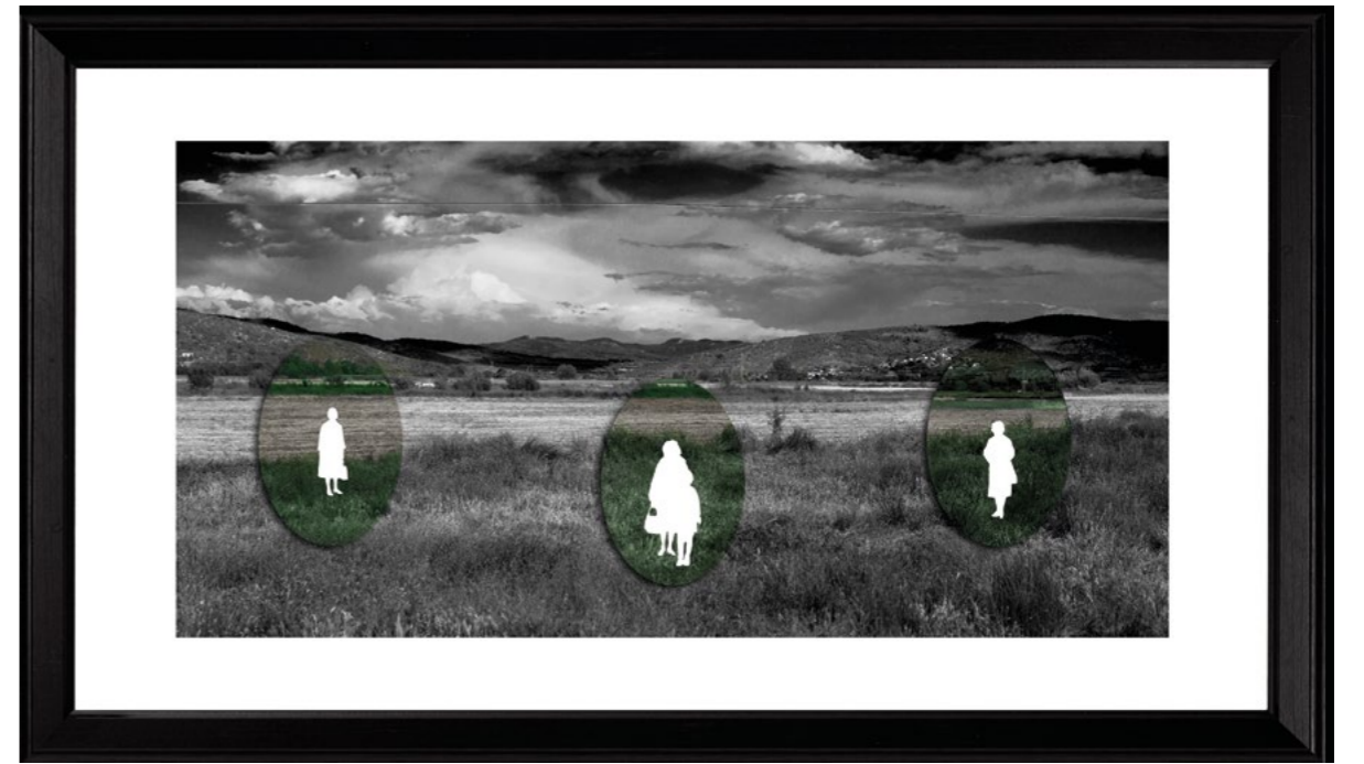
Deniz Yılmazlar | Karbon, İsimli No:3, 2015 70x35 cm, Fine Art Kağıdına Siyah Beyaz Fotoğraf ve Elips Seramik

Deniz Yılmazlar | Karbon, Untitled Nr:2, 2015 70x35 cm, Black And White Photography On Fine Art Paper And Ellipse Ceramic